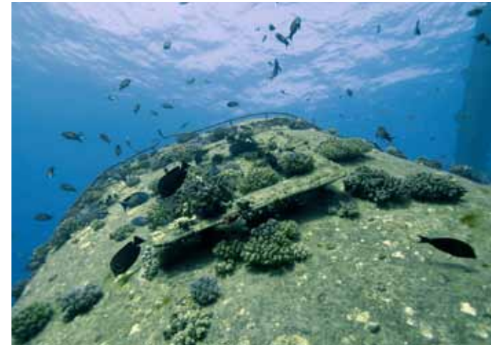
Das mit Korallen überwachsene «D» am Schornstein.

wie vom Rumpf abgeschnitten, komplett auf der Backbordseite, das Deck vom Riff abgewandt. An der Bugwand ist noch der ursprüngliche japanische Name Shoyo Maru zu erkennen. Der Bug bietet eine schöne Fotogelegenheit und etwas reicheren Korallenbewuchs, da sich die Taucher meist auf das Heck konzentrieren.