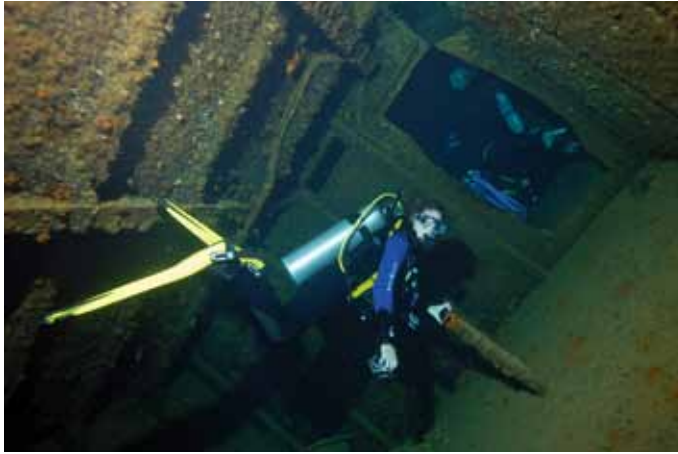
Einstieg ins Wrack durch die Türe im Heck. Schön einer nach dem anderen.

angerichtet hatte. Die Brandung des nun abklingenden Sturmes schleuderte die auf dem Wasser schwimmenden Holzbalken gegen das Riff und setzte diesem weiterhin zu.