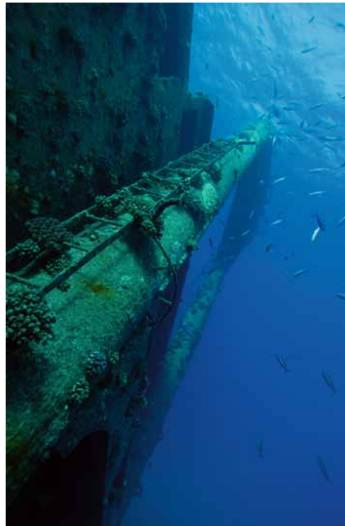
Am Ladebaum haben sich bereits Korallen angesiedelt.

Name: Shoyo Maru (1969), Markos (1975), Giannis D (1980) Baujahr: 1969 Werft: Kuryshima Dock Co., Imabari, Japan Abmessungen: 99,5 x 16 x 6,53 m Tonnage: 2932 BRT Antrieb: 6-Zylinder-Diesel Verlust: 19. April 1983 Tiefe: 27 m bis 4 m Position: 27° 34' 38" N, 33° 55' 25" O