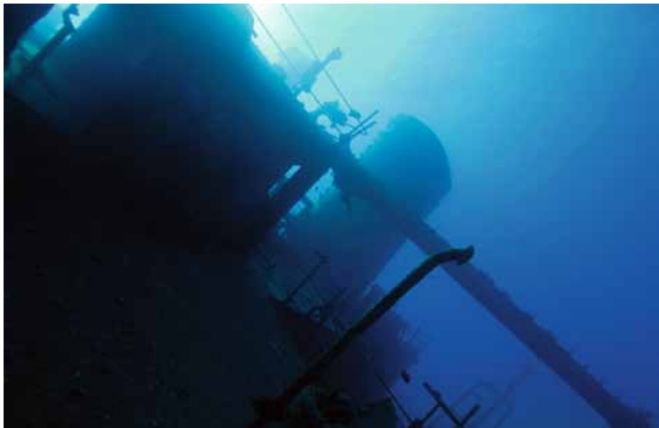
Aufbauten mit Kamin.

Vom Mittschiff ist ausser Trümmern nicht mehr viel geblieben, doch der Bug ist mitsamt Anker und Winden noch ziemlich intakt. Er liegt,