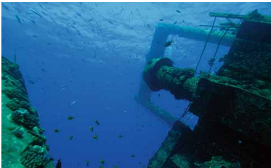
Belüftungsrohr der Giannis D .

Das vom Rest des Wracks abgetrennte Heck bietet durch eine offen stehende Türe leichten Zugang zur Brücke, zu den Niedergängen, dem Unterkunftsbereich, einigen Vorratskammern und dem Maschinenraum, in dem sich noch eine Luftkammer befinden soll. Eine Reihe von Bullaugen erlaubt es den Sonnenstrahlen, ins Wrack vorzudringen und eine atemberaubende Atmosphäre des Zwiellichts zu schaffen. Eine Herausforderung für jeden Kameramann, diesen visuellen Eindruck so festhalten zu können. Schullen von Glasfischen umgarnen die