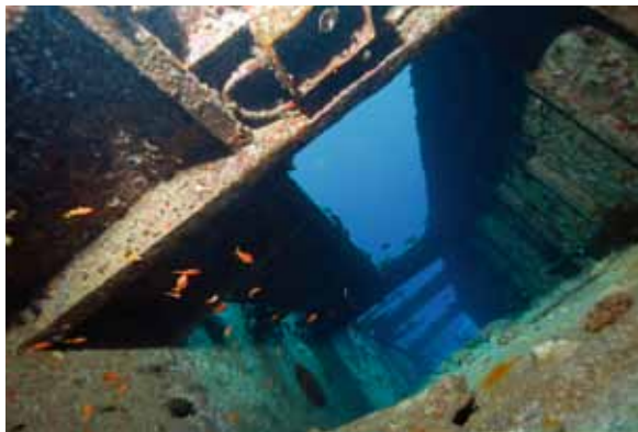
Die Galerie an der Seite des Wracks.

Sturms entzwei, rutschte den Hang hinunter und landete auf dem Grund in etwa 27 Metern Tiefe, den Rumpf etwa 45° nach Backbord geneigt. Die Laderäume waren kollabiert, doch Bug und Heck blieben ziemlich intakt.