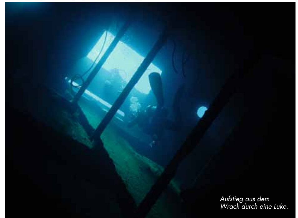
Aufstieg aus dem Wrack durch eine Luke.